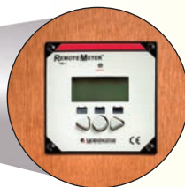
Montaje en la pared