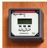
Montaje con marco