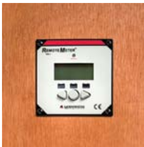
Montaje en pared