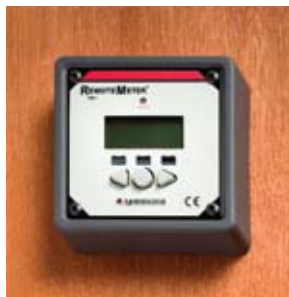
Montaje con marco