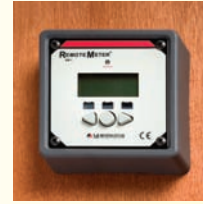
Befestigung mittels Halterung